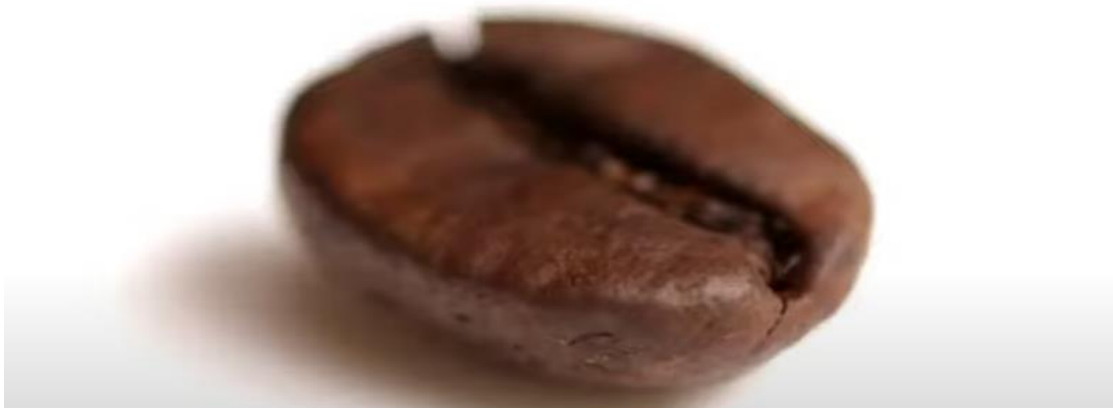
Imagen 1: El grano del café ha sido el elemento principal de Café Quindío para enamorar a sus clientes.

Hablar de Café Quindío es hacer alusión a un grano de este producto, ya que detrás de él hay miles de compuestos químicos, lípidos, azúcares, grasas, entre otros, siendo así el gran punto de inspiración para que naciera esta empresa, que se encuentra ubicada en el triángulo del café de Colombia, compuesto de tres departamentos: Quindío, Risaralda y Caldas. En esta zona se desarrolló la cultura cafetera a partir del año 1920 con la colonización antioqueña. Desde Antioquia empezaron a buscar nuevas tierras para desarrollar temas de cultivos y agro y fue de esta manera como se empezó a posicionar este producto en el Quindío, que si bien es el departamento más pequeño de Colombia (1.845 km 2 ), es el más aromático y con más sabor a café en todo el país.