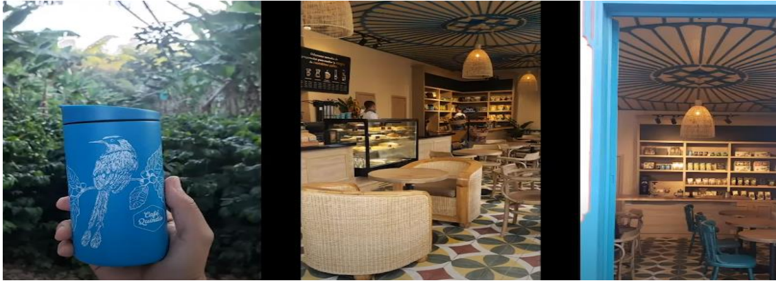
Imagen 8: Así es el interior de una de las tiendas de Café Quindío.

El concepto de tiendas se ha ido consolidando positivamente, porque se tienen las dos unidades de negocios, tanto en supermercados, como las tiendas propias y cuando se analizan los números hay concordancia, porque las tiendas generan flujo de caja y los supermercados lo hacen con volumen. Actualmente, Café Quindío cuenta con 32 tiendas en el país y todas se caracterizan por ser experienciales, puesto que los clientes pueden vivir la mayor expresión de la marca, porque no van solamente por tomarse un café, sino por compartir.