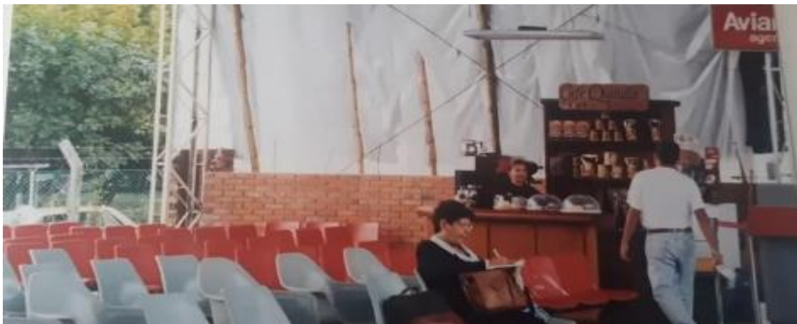
Imagen 11: Pese al terremoto que se dio en el Quindío, esta empresa logró sostenerse y dio saltos de calidad. Esta foto corresponde al aeropuerto que estaban construyendo luego del mencionado suceso.

En 1999 la zona cafetera vivió uno de los momentos más trágicos de su historia a raíz de un fuerte terremoto que acabó con la vida de aproximadamente 1500 personas. En la siguiente foto se evidencia que en el aeropuerto que se estaba construyendo luego de este lamentable hecho, el puesto de Café Quindío era uno de los pocos locales que había allí. En esa época la compañía era muy regional, muy local, porque no había a quien venderle una libra de café en ese momento. Sin embargo, esta empresa hizo de este acontecimiento una oportunidad, porque se pasó de pensar en ser una empresa regional a una nacional. Desde ese momento se empezaron a buscar clientes de otras zonas del país para que la compañía no se cerrara en aquella época.