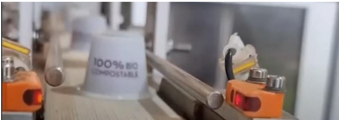
Imagen 5: Las cápsulas han sido uno de los principales productos innovadores de Café Quindío.

En un principio resultaba complejo lograr codificar el tema de las cápsulas en cadena, puesto que con Nespresso se planteaba que había riesgos, porque se le compraban productos a Nestle en grandes cantidades. No obstante, Café Quindío contaba con un estudio jurídico donde podía compartir la compatibilidad de la cápsula, siempre y cuando no le hicieran daño a un tercero, en este caso a la marca Nestle.