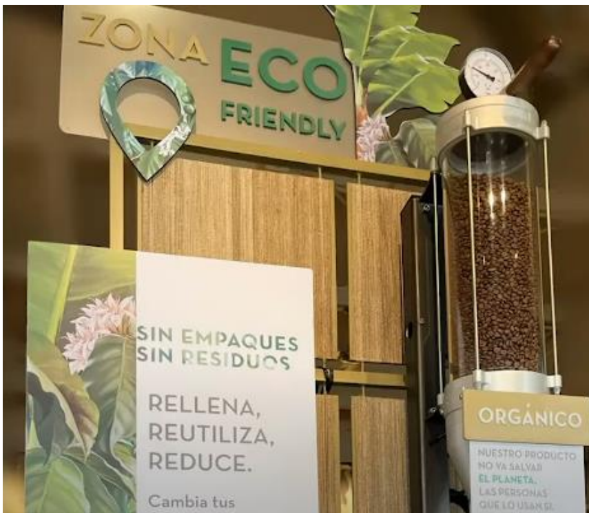
Imagen 7: Los silos traídos de Italia han contribuyen de manera positiva al medio ambiente.

Siguiendo con el hilo del reto de innovación dentro de la empresa, el equipo administrativo presentó un programa de sostenibilidad basado en los silos de café (equipos para secamiento de café), hay que tener en cuenta que estos normalmente no guardan la calidad del producto porque no están herméticamente cerrados y el peor enemigo del café es el oxígeno, fue por esto que se trajeron silos de Italia, que vienen con nitrógeno y guardan la calidad del producto. Con esto se busca que las personas compren su empaque de vidrio, que es totalmente hermético, y hagan el repeal (derogación de estándares café) en estos silos. Por cada cinco libras de café que se venden con repeal en estos frascos, se están dejando de emitir 0.5 kilos de CO2 al planeta, lo que significa que este programa viene tomando fuerza, de hecho, ya está en tres de las tiendas de Café Quindío (Bogotá, Armenia y Cartagena).