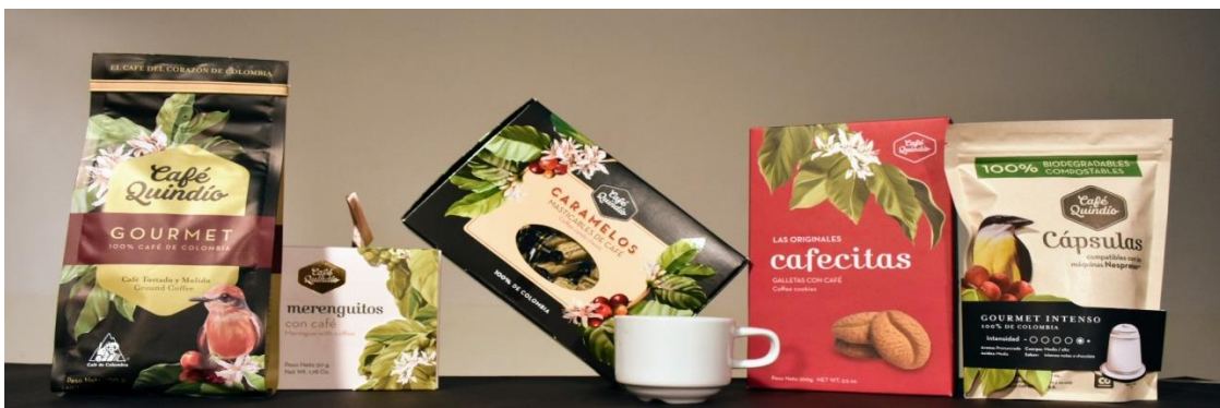
Imagen 9: La calidad es uno de los aspectos claves para que los productos de Café Quindío sean reconocidos.

La estrategia se ha enfocado en generar una experiencia de marca con muchos componentes como el diseño de los empaques, los materiales que se utilizan y la manera en la que se atiende al cliente. Por esta razón las personas encuentran en Café Quindío una variedad de opciones. El factor diferencial no comprende de una sola actividad, sino a una serie de situaciones que confluyen y van alineadas hacia una experiencia diferente.