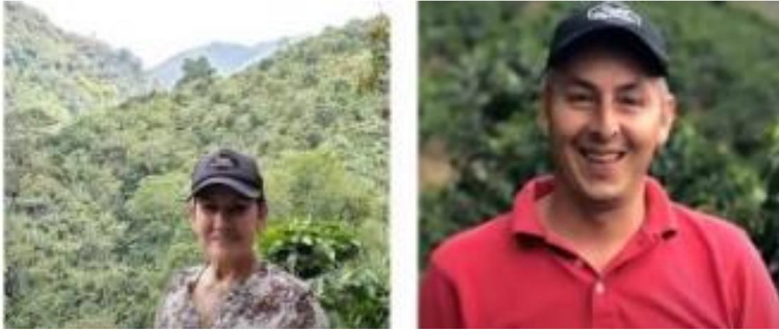
Imagen 12: Con caficultores como ellos se viene trabajando todo el tema de dignidad cafetera.

También se viene desarrollando una trilla asociativa (consiste en remover la cáscara del grano en pergamino o cereza seca hasta transformarlo y clasificarlo de forma mecánica y electrónica en café verde o excelsa, dejándolo listo para exportación) para lograr traer a los caficultores adelante en la cadena. Se pretende eliminar todos los procesos de intermediación, lo cual sería muy disruptivo en el suministro del café y les traería resultados positivos a ellos. Además, se está en el proceso de que estas compras sean 100% con este modelo (se recomienda la lectura Innovación con Propósito: caso Progeny Coffee ) aunque, requiere de muchos cambios a nivel interno por las necesidades que pueden tener los caficultores. No obstante, la idea es suplirlas y ser la mejor opción de venta y acompañamiento para ellos, porque se ha presentado el caso de que no se les reconoce la labor, incluso, hay empresas que les pagan una sobretasa y vuelven en tres o cinco años. El objetivo es no dejar a los caficultores de lado, porque ellos son el corazón de Colombia. Cuando se conjuga lo que viene detrás de cada grano, toma vía el propósito de sorprender y enamorar con la magia y el café del corazón del país.