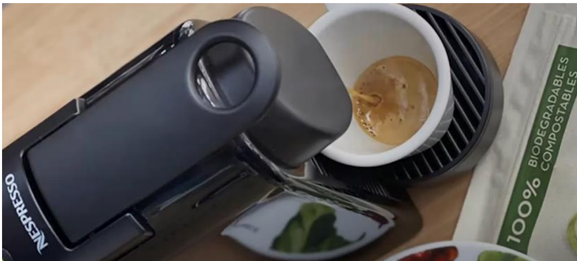
Imagen 4: La Máquina Nespresso ha jugado un papel importante en el éxito que ha tenido Café Quindío.

De esta manera se comenzó a desarrollar este proyecto, incluso, se llevó a cabo un viaje a Italia en el que se tenía como objetivo principal encontrar máquinas encapsuladoras, cápsulas vacías y la forma sobre cómo se podría desarrollar el café en esas cápsulas, porque además de poner el café tostado y molido, se debía tener en cuenta que para ello se requería de un proceso de desgasificación y tuestión especial, así como tener un mercado vigente. La llegada a territorio italiano fue positiva para los intereses de Café Quindío, ya que encontraron una máquina que permite hacer 70 cápsulas por minutos, estas últimas se traen vacías desde Bélgica, son biodegradables, compostables, hechas con biopolímeros, son Honkong Post y a los 25 días aproximadamente, se descomponen sin dejar residuos químicos y físicos que afecten el medio ambiente.