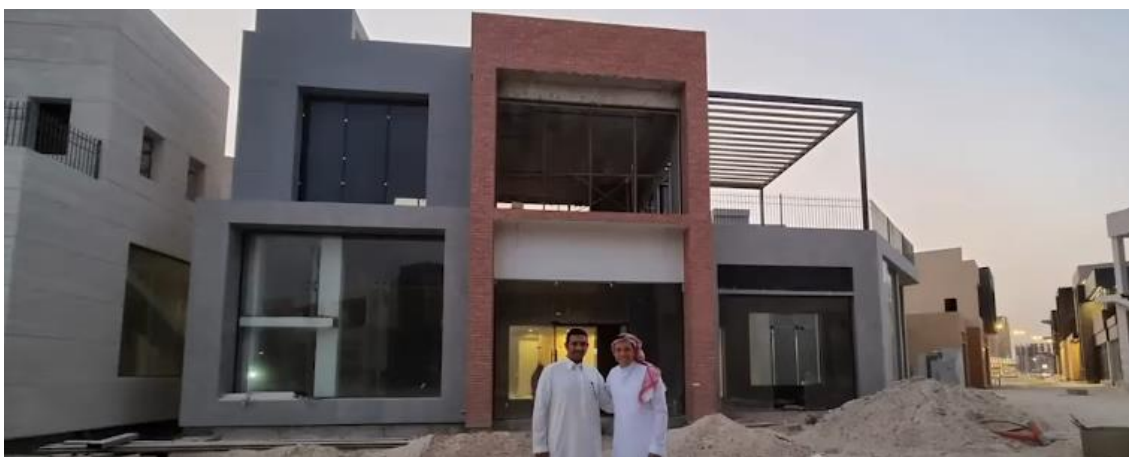
Imagen 13: En Arabia Saudita se está construyendo la primera tienda internacional de Café Quindío.