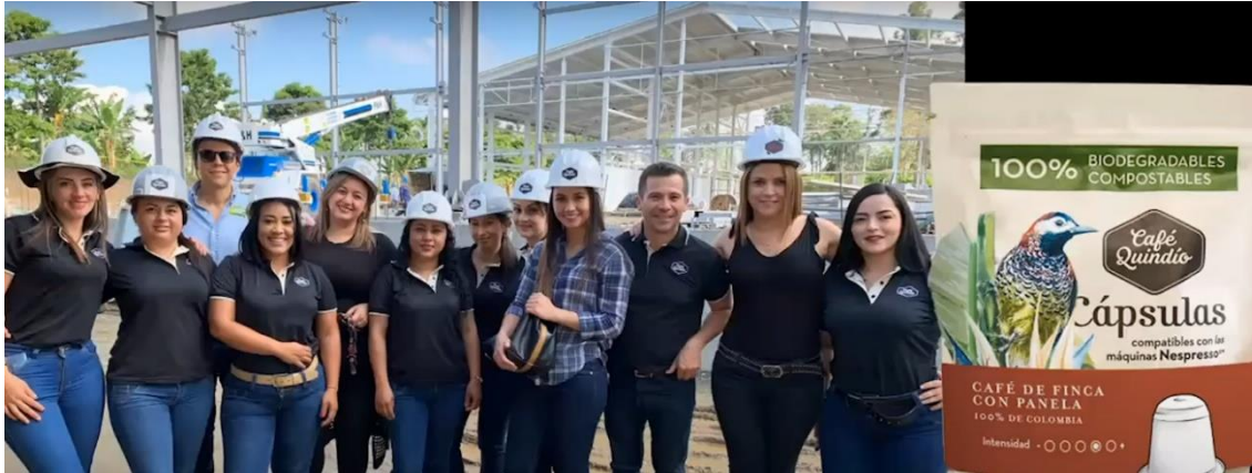
Imagen 6: El equipo comercial propuso la creación de cápsulas de café endulzadas con panela y hoy por hoy, este es uno de los productos estelares de Café Quindío.

Siguiendo con el hilo del reto de innovación dentro de la empresa, el equipo administrativo presentó un programa de sostenibilidad basado en los silos de café (equipos para secamiento de café), hay que tener en cuenta que estos normalmente no guardan la calidad del producto porque no están herméticamente cerrados y el peor enemigo del café es el oxígeno, fue por esto que se trajeron silos de Italia, que vienen con nitrógeno y guardan la calidad del producto. Con esto se busca que las personas compren su empaque de vidrio, que es totalmente hermético, y hagan el repeal (derogación de estándares café) en estos silos. Por cada cinco libras de café que se venden con repeal en estos frascos, se están dejando de emitir 0.5 kilos de CO2 al planeta, lo que significa que este programa viene tomando fuerza, de hecho, ya está en tres de las tiendas de Café Quindío (Bogotá, Armenia y Cartagena).