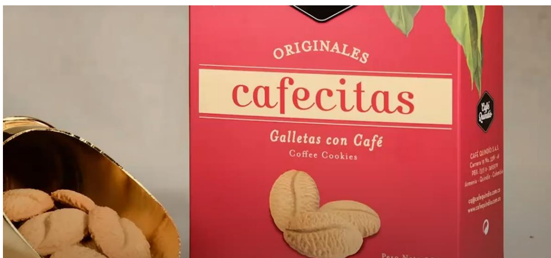
Imagen 3: Las Cafecitas es uno de los productos que más consumen los clientes de Café Quindío. Fuente: material Aroma de Innovación Café Quindío.

La principal idea de Café Quindío siempre ha sido generar valor agregado y eso le ha permitido crear diversos productos, siendo esto fundamental para tener una estructura transversal de innovación muy importante para la compañía. Referirse a los nuevos productos de esta marca significa conocer la manera en que estos comenzaron a generarse y aquí jugó un papel importante la fundadora de esta organización, que era muy amante a la gastronomía. Ella, comenzó a ir a clases de pastelería en Bogotá, cuando regresaba al Quindío preparaba galletas, las ensayaba, le enviaba al profesor una carta con unas muestras y fue de esta manera como se desarrollaron las Cafecitas , el primer producto fuera de la línea del café y uno de los best-sellers del mercado (uno de los productos más vendidos). Después, en la misma planta de producción se fueron creando otros productos alrededor del café como los merengues , caramelos , mermeladas , entre otros. Claramente quedaba demostrado que a esta empresa ya no solo se le miraba como una tostadora, sino que también se le resaltaba por generarles a sus clientes nuevas experiencias entorno al café, siendo una de las primeras tostadoras en el mundo en lograr esto.